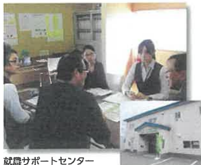
就農サポートセンター